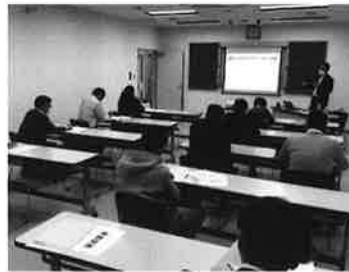
「経営分析セミナー」

今後、事業計画策定を希望する方に対し、経営革新計画や小規模事業者持続化補助金の申請と合わせて個別相談を実施していきます。