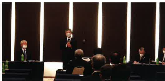
▲日本商工会議所よりの感謝状贈呈