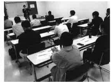
「事業計画策定セミナー」