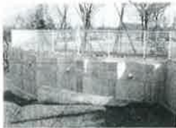
親杭パネル壁工法