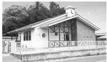
少人数制 キッズハウス保育園