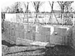
親抗パネル壁工法