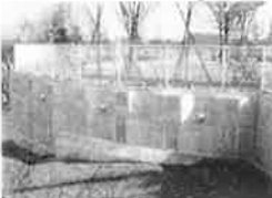
親杭パネル壁工法