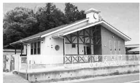
少人数制 キッズハウス保育園