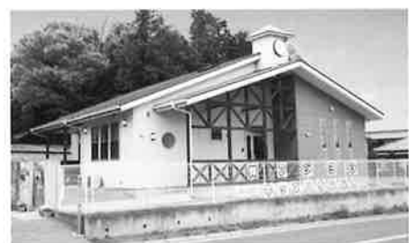
少人数制 キッズハウス保育園