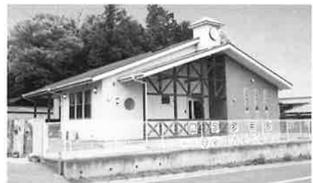
少人数制 キッズハウス保育園