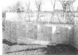
親杭パネル壁工法