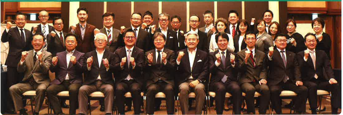
第25期役員・議員改選後、初めての常議員会が開催されました（11/10）