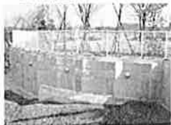
親抗パネル壁工法