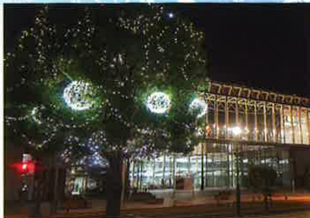
下館商工会議所青年部主催 稲荷町通りイルミネーション