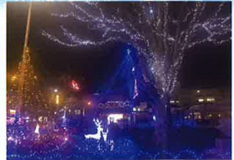
下館さくら商店街振興組合主催 下館駅南口ロータリー広場「星のファンタジー」

点灯時間：午後5時～午後10時 点灯期間：令和7年12月5日～令和8年3月29日まで