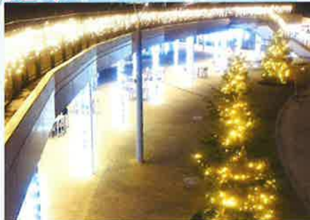
道の駅グランテラス筑西 ウィンターイルミネーション

点灯時間：午後5時～午後11時 点灯期間：令和7年12月1日～令和8年1月31日まで