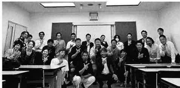
(しもだて商工まつり2026 実行委員の皆様)