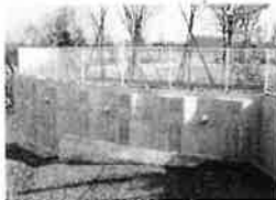
親杭パネル壁工法